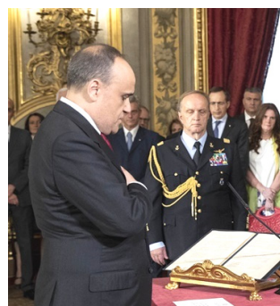
Il Presidente Sergio Mattarella con il Ministro dei Beni e delle Attività Culturali e del Turismo, Alberto Bonisoli.