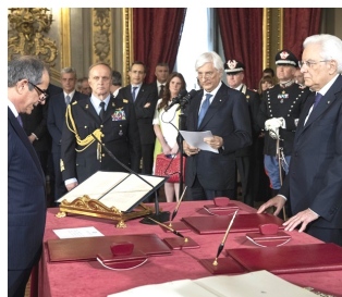
Il Presidente Sergio Mattarella con il Ministro dell'Economia e delle Finanze, Giovanni Tria.