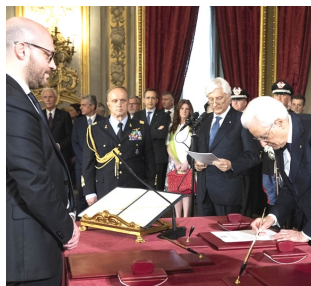
Il Presidente della Repubblica Sergio Mattarella con Lorenzo Fontana, Ministro senza Portafoglio.