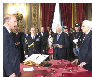
Il Presidente Sergio Mattarella con il Ministro dell'istruzione, dell'Università e della Ricerca, Marco Busetti.