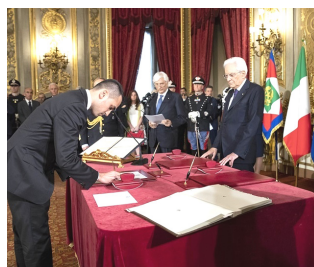
Il Presidente della Repubblica Sergio Mattarella con Luigi Di Maio, Ministro dello Sviluppo Economico, del Lavoro e delle Politiche Sociali, con funzioni di Vice Presidente del Consiglio dei Ministri.