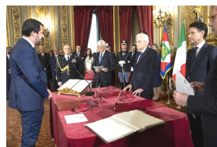
Matteo Salvini, Ministro dell'Interno, e Vice Presidente del Consiglio dei Ministri.