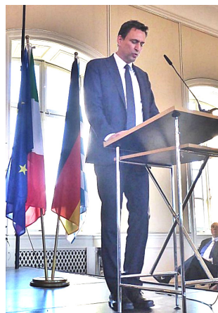
Georg Eisenreich Ministro per l'Europa, il digitale e i media