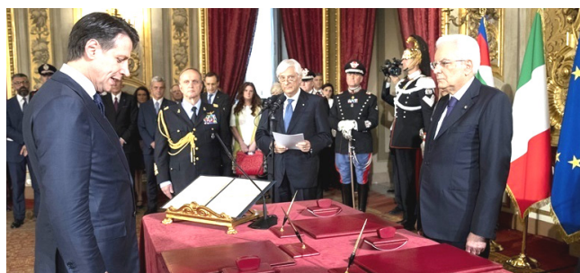
Il Presidente della Repubblica Sergio Mattarella con il Presidente del Consiglio dei Ministri Giuseppe Conte.