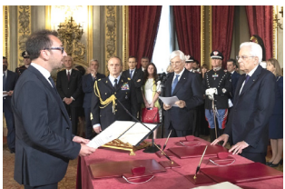
Il Presidente della Repubblica Sergio Mattarella con il Ministro della Giustizia, Alfonso Bonafede.