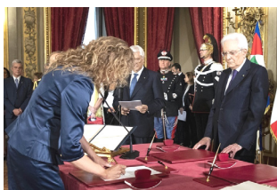
Il Presidente della Repubblica Sergio Mattarella con Erika Stefani, Ministro degli Affari Regionali e delle Autonomie.