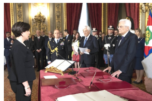
Il Presidente Sergio Mattarella con il Ministro della Difesa, Elisabetta Trenta.