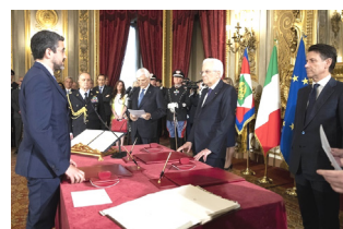
Il Presidente della Repubblica Sergio Mattarella con Riccardo Fraccaro, Ministro senza Portafoglio.