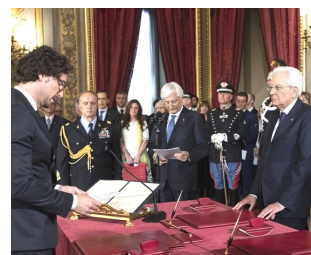
Il Presidente Sergio Mattarella con il Ministro delle Infrastrutture e dei Trasporti, Danilo Toninelli.