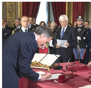
Il Presidente Sergio Mattarella con il Ministro degli Affari Esteri e della Cooperazione Internazionale, Enzo Moavero Milanesi.