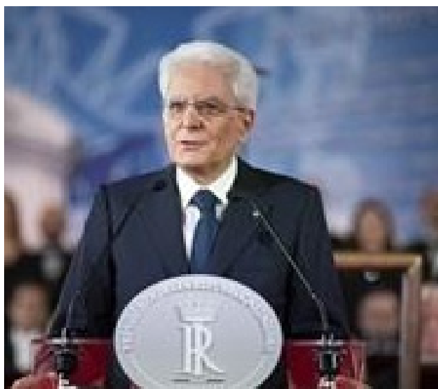
Sergio Mattarella Presidente della Repubblica Italiana