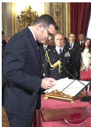
Il Presidente Sergio Mattarella con il Ministro delle politiche agricole, alimentari e forestali, Gian Marco Centinaio.