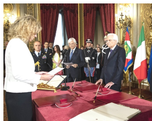
Il Presidente della Repubblica Sergio Mattarella con Barbara Lezzi, Ministro senza Portafoglio.