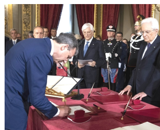
Sergio Mattarella con il Ministro dell'Ambiente e Tutela del Territorio e del Mare, Sergio Costa.