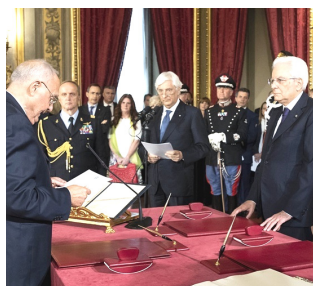
Il Presidente della Repubblica Sergio Mattarella con Paolo Savona, Ministro senza Portafoglio.